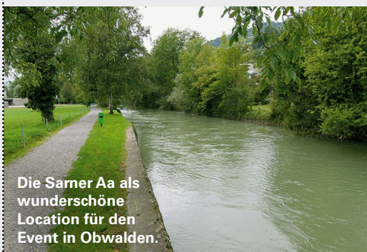
Die Sarner Aa als wunderschöne Location für den Event in Obwalden.

Um auf den Event aufmerksam zu machen, möchten sich die Obwaldner mit ihrer Idee im Vorfeld an die Presse richten und so die breite lokale Bevölkerung informieren. Am Vormittag des Events wird zudem an einem kleinen Infostand am Sarner Wochenmarkt auf das Programm aufmerksam gemacht. Für die offizielle Eröffnung wird die Presse eingeladen.